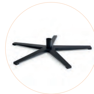
GRKMF7 Estrella ancha Negro, pulido y cepillado