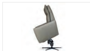
MECANISMO 2 MOTORES Y POWER LIFT

Permiten por separado y en multitud de posiciones, reclinar el respaldo y elevar las piernas.