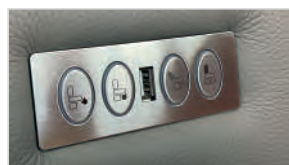
PULSADORES CON USB

Solamente para las versiones eléctricas, mediante 4 pulsadores se puede por separado reclinar y recoger tanto el respaldo como las piernas en múltiples posiciones. Situados a la izquierda (visto de frente).