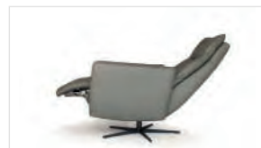
MECANISMO 2 MOTORES

Mediante el muelle de gas se reclina el respaldo en varias posiciones y también de forma independiente se elevan las piernas en diferentes ángulos.