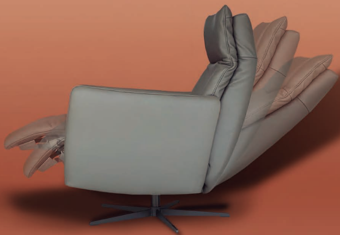
Movimiento del cabezal (manual y eléctrico)