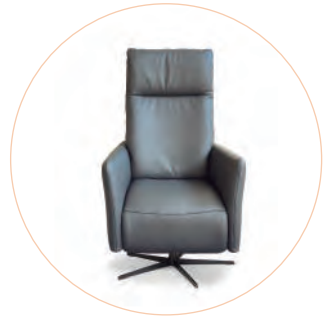
MEDIUM Altura asiento 45cm Altura total 112cm