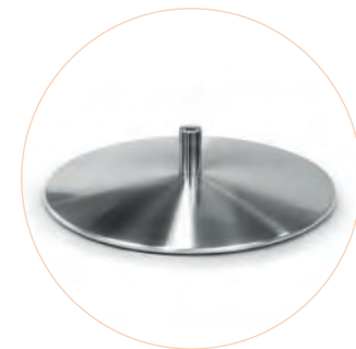
GRTMFI Negro y cepillado