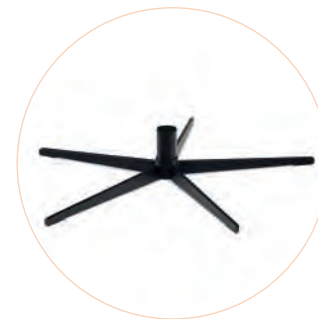
GRKMF3 Estrella estrecha Negro, cromado y inox