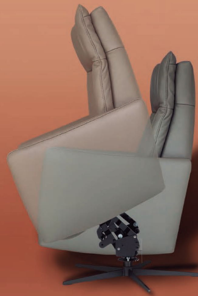
Power Lift (sistema de elevación eléctrico)